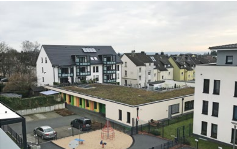
Blick auf das Herzog-Carrée 1 mit der Kita, rechts HerzogCarré 2

Die Nähe zur Innenstadt, vor allem aber die Nähe zu dem neuen Einzelhandelsangebot in der Oberstadt wird von allen Bewohnern sehr geschätzt, Einkäufe können ohne Probleme zu Fuß erledigt werden. Die Gesamtmaßnahme von 29 Wohnungen mit KiTa war für den spar und bau eine der größten der letzten Jahrzehnte, zugleich ein positiver Beitrag der städtebaulichen Entwicklung dieses Velberter Stadtteils.