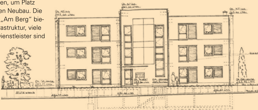
Skizze der Frontansicht

Nachdem keine Weitervermietungen mehr erfolgten, wurde das Gebäude sukzessive freigezogen, so dass ab Mitte 2017 mit den konkreten Planungen für den Neubau begonnen werden konnte. In der nächsten inside werden wir weiter berichten.