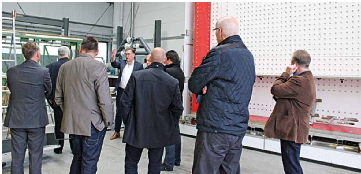
Interessante Besichtigung im PIV